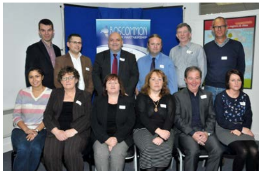
Project partners pictured at the kick off meeting in Roscommon

Ledda av Roscommon Leader Partnership, består Creative Communities Igniting Change-projektet av samarbetspartners från Nordirland Banbridge Distinct Council och Canice Consulting, Sverige (Folkuniversitetet i Skåne län), Polen (Nordkammaren, Szczecin och Humanistiska och Ekonomiska Universitetet, Łódź och Irländska partners Momentum